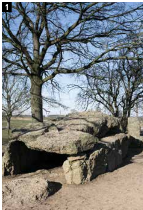
1 De Dolmen van Wéris, een indrukwekkend hunebed of stenen tafel, waar ook enkele stukjes menselijk bot werden teruggevonden. 2 IJskoud of niet, we willen toch héél even buiten zitten.