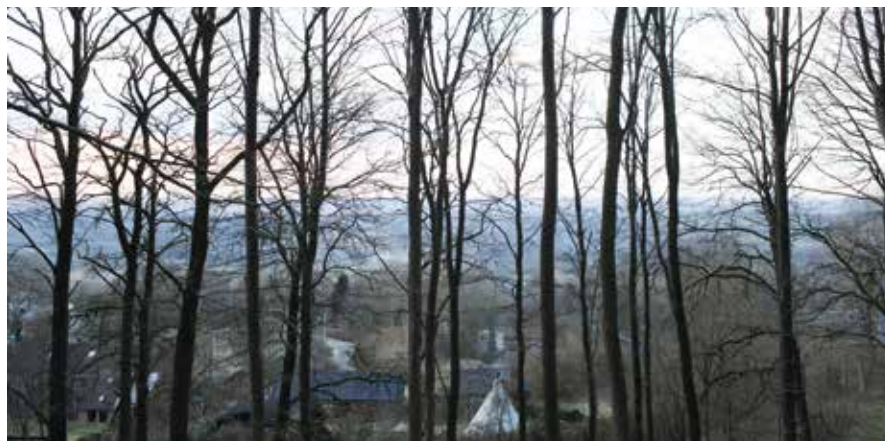
Zicht op onze tipi tijdens een wandeling over de 'Drakenrug' in Heyd.