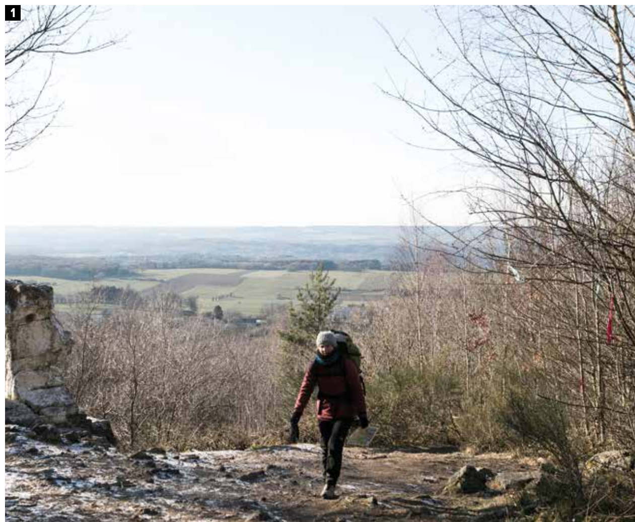
1 Prachtig uitzicht aan de 'Witte Menhir' die volgens de legende een gang naar de hel bedekt. 2 De omgeving van Wéris is bezaaid met dolmens en menhirs. 3 In de vrieskou op zoek naar de juiste weg. 4 Een klein, schattig dorpje met een kerk van duizend jaar oud: welkom in Wéris.